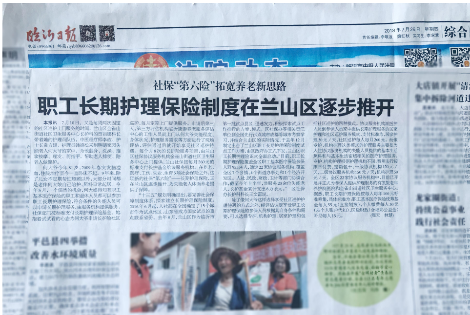
(图为《临沂日报》第三版长护相关报道)

7 月 26 日, 由区新闻中心主任周天执笔的文章《社保“第六险” 拓宽养老新思路 职工长期护理保险制度在兰山区逐步推开》在《临沂日报》第三版发表。